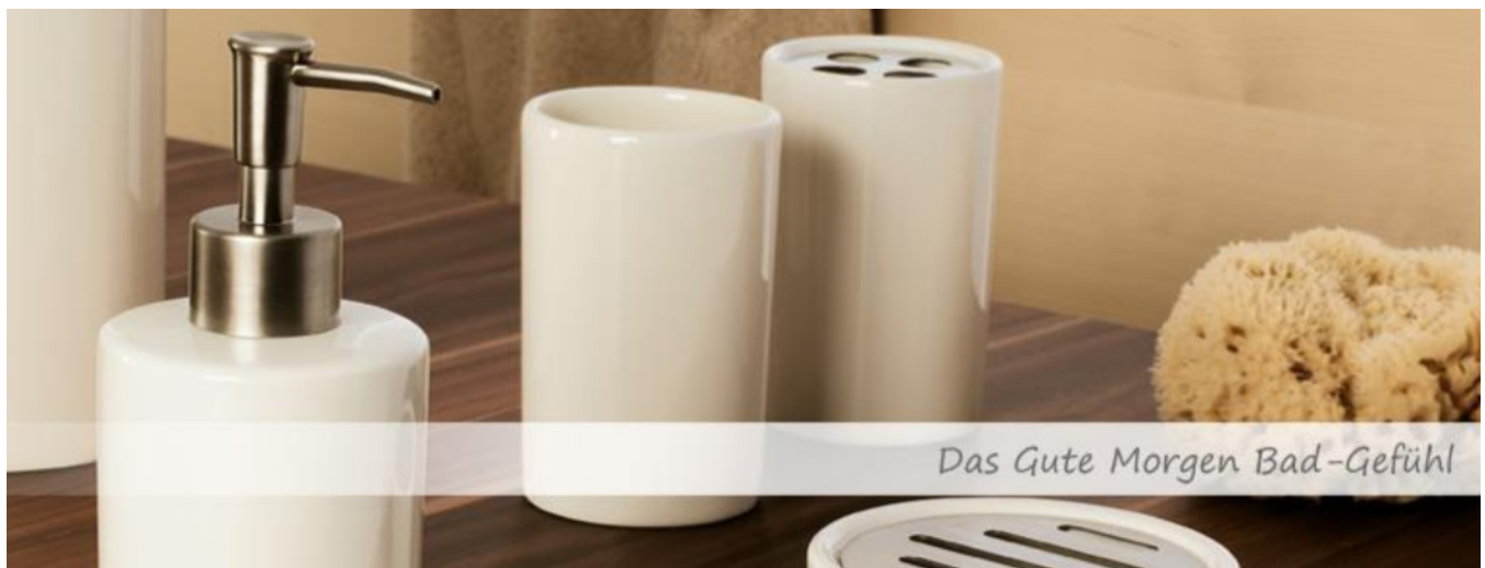
Das Gute Morgen Bad-Gefühl

Das Familienunternehmen Ridder zeichnet sich durch seine über 50-jährige Erfahrung, den hohen Qualitätsstandard - unterstrichen durch die 3-jährige Qualitätsgarantie auf alle Produkte -, perfekten Service, sowie durch innovative Produkte im Bereich der Badausstattung und dem Komfort und der Sicherheit im Bad aus. Ob hochwertige Badteppiche, trendige Duschvorhänge, äußerst sichere Dusch- und Wanneneinlagen oder stilvolle Bad-Accessoires – RIDDER bietet Ihnen erlesene Qualität für ein exklusives Bad-Gefühl! Farben, Designs und Qualitäten werden sorgfältig aufeinander abgestimmt, damit keine Wünsche offen bleiben.